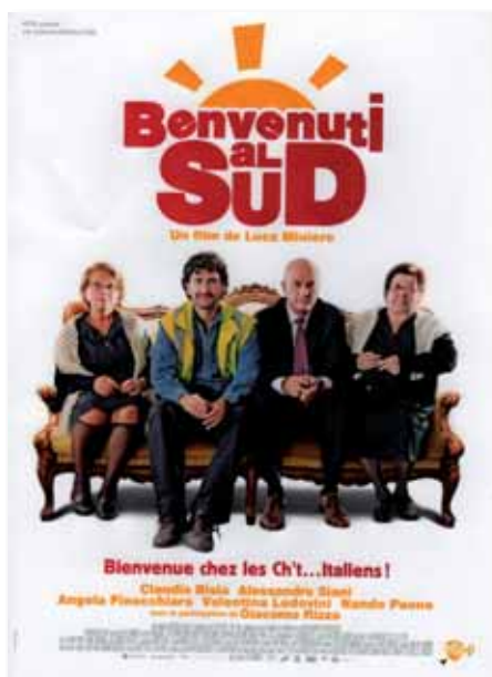
La locandina del film "Benvenuti al Sud"

In controtendenza rispetto al comune sentire italico anche l'opinione sul Sud. Si dirà che l'orientamento era tutto sommato scontato, visto che la